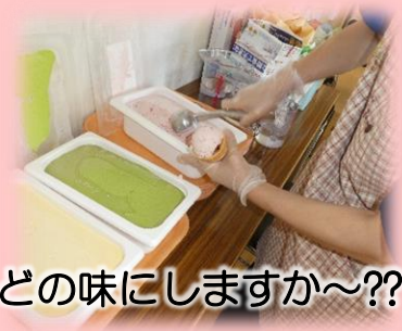
どの味にしますか~??