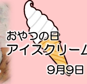
おやつの日 アイスクリーム