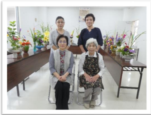
本立寺仏婦様（7月16日）