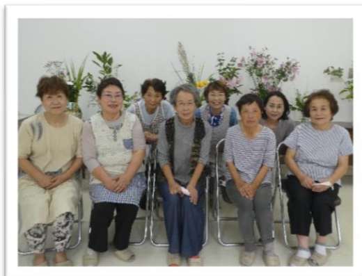
安養寺仏婦様（9月17日）