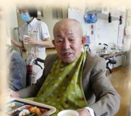
わしは ノンアルコール♪

巻寿司 稲荷寿司 刺身盛合わせ 天ぷら 炊き合わせ 紅白なます 果物 茶碗蒸し 潮汁