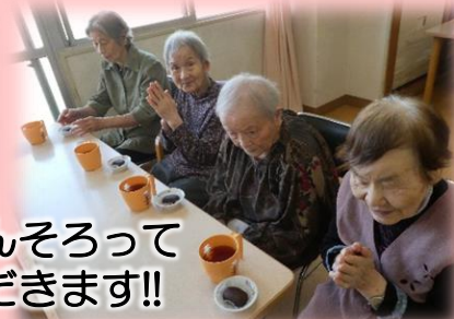
皆さんそろって いただきます!!