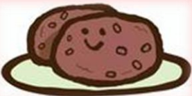
おやつの日 おはぎ 9月22日