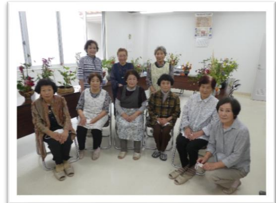
香源寺仏婦様（8月20日）