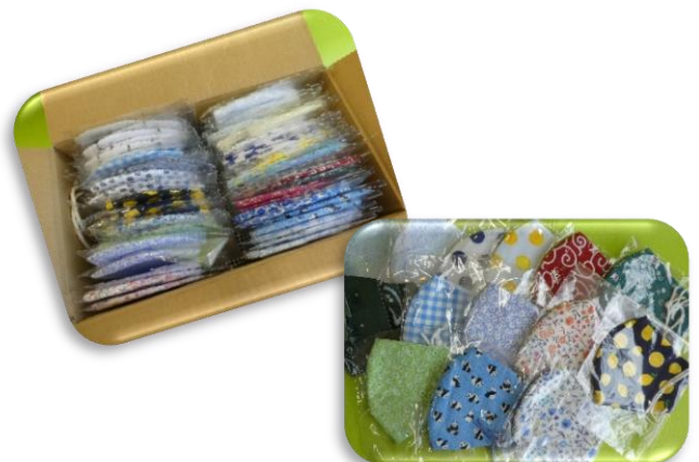
ご家族からの手作りマスク（8月）