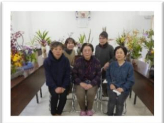
明覚寺仏婦様 (11月19日)