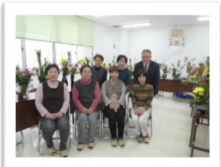
阿坂女性会様 (12月28日)