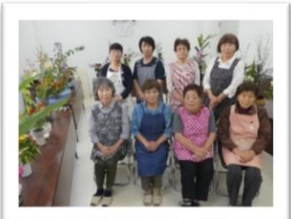
薬王寺仏婦様 (10月15日)