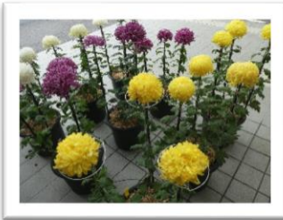
観賞菊 清水公三様 (11月)