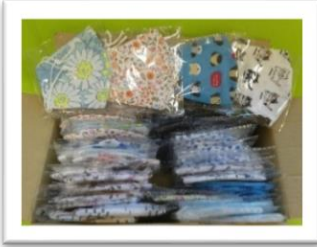
ご家族からの手作りマスク (12月)