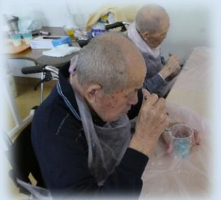
6月16日 おやつの日 (ゼリー)