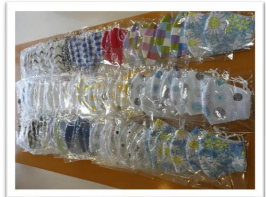
ご家族からの手作りマスク（5月）