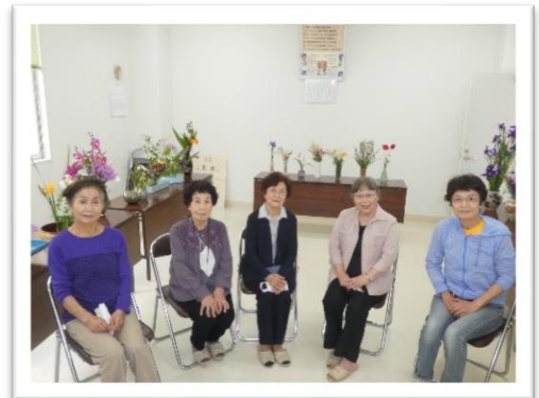
浄圓寺仏婦様（5月14日）