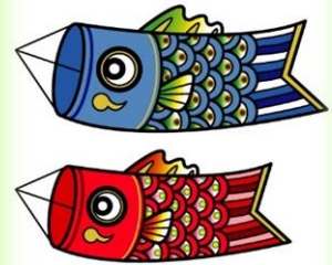
5月 鯉のぼりの工作 (デイ)