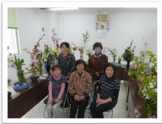
教善寺仏婦様（4月16日）