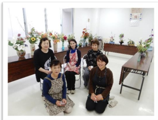
西楽寺仏婦様（6月18日）