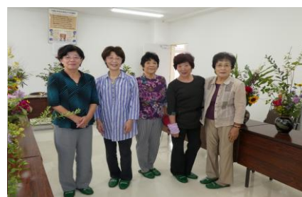
教善寺仏婦様（9月16日）