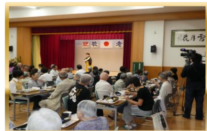
きたひろネット撮影風景