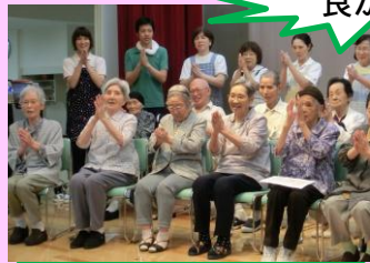
みごとに揃っています

今年もビアガーデンの余興に向けて、2カ月前から練習を重ね、本番を迎えました。練習の成果が表れ、「富士の山」は手振りがキレイに揃い、「きたひろしまの歌」は大きな声で唱われ、満足のいくものでした。