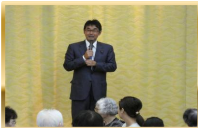
河井克行衆議院議員様