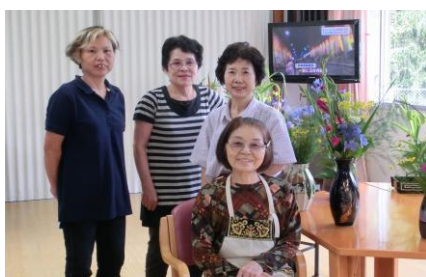
明覚寺仏婦様（7月15日）