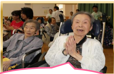
今日は良い日ですね