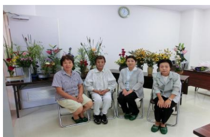
善浄寺仏婦様（8月19日）