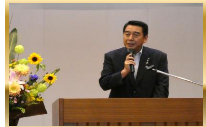
箕野北広島町長様