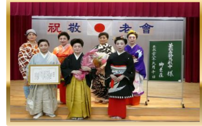
華松寿静乃社中様