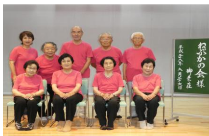
ねぶかの会様（8月26日）