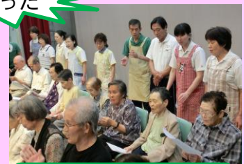
今回、カラオケに挑戦