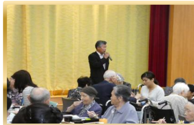
宮本新八県議会議員様