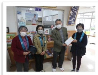
山県中組仏教婦人会様 (3月18日)