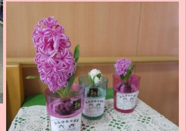
人権の花（豊平小学校の皆さん）